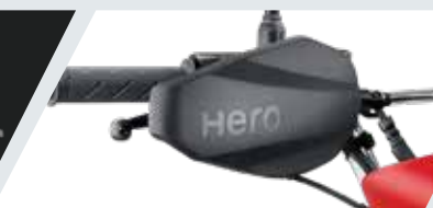
PROTECTOR DE NUDILLOS