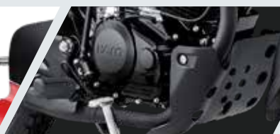
PROTECTOR DE MOTOR