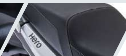
SILLÍN DOBLE NIVEL PARA MAYOR COMODIDAD DE CONDUCCIÓN