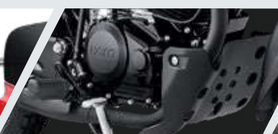
PROTECTOR DE MOTOR