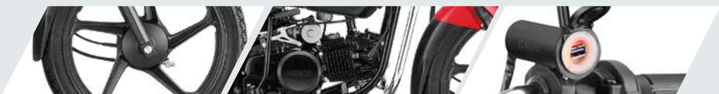
RINES DE ALEACIÓN