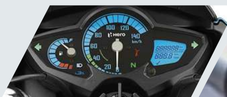
TABLERO DIGITAL Y ANÁLOGO