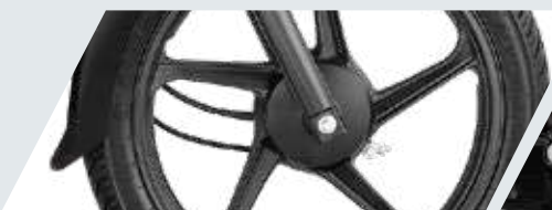
RINES DE ALEACIÓN