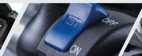
TECNOLOGÍA SMART DRIVE PARA AHORRO DE COMBUSTIBLE