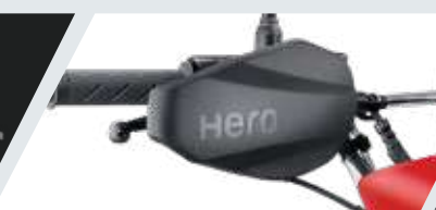
PROTECTOR DE NUDILLOS