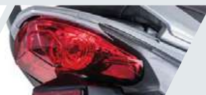
STOP DEPORTIVO QUE BRINDA UN DISEÑO MODERNO A LA MOTOCICLETA

*Fotografías de referencia, Los modelos pueden variar según el país